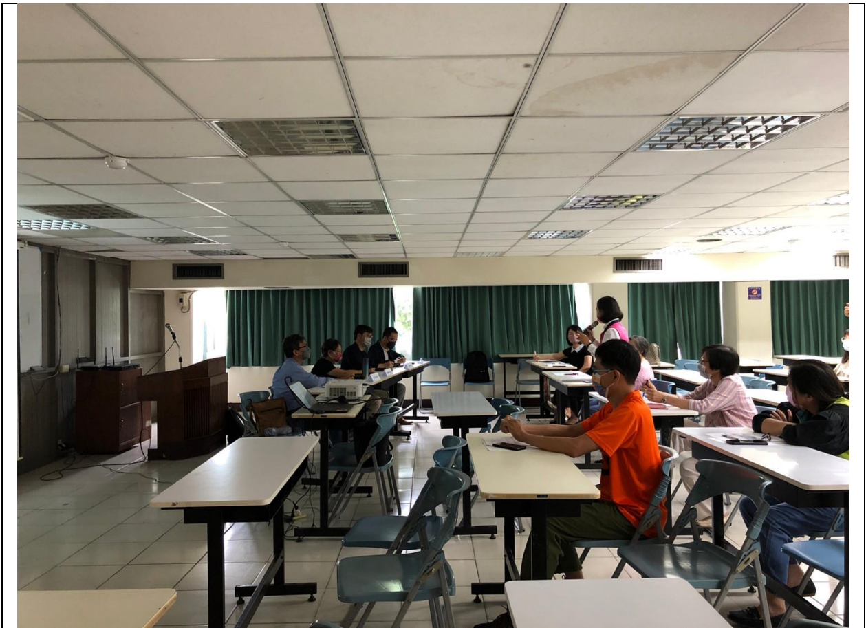
圖 6、說明會－相關意見交流(議員發言)