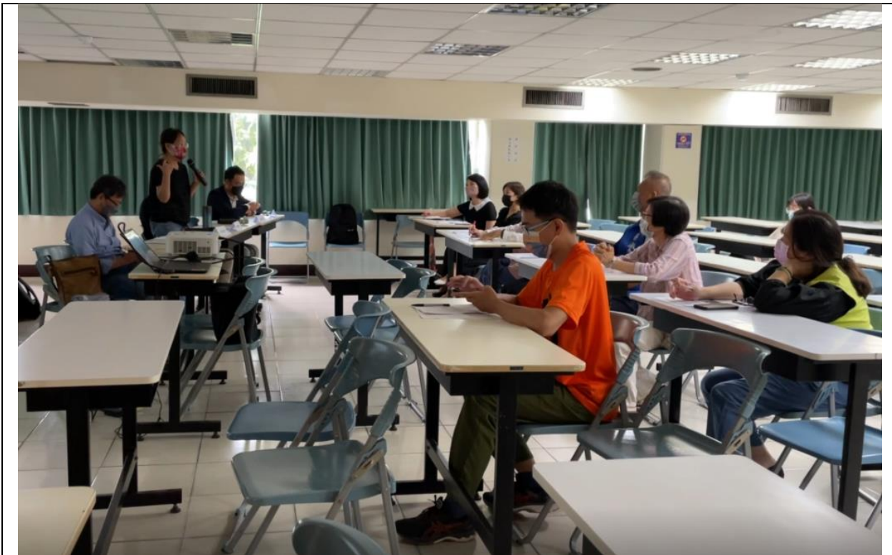
圖 8、說明會－專家學者意見與回應