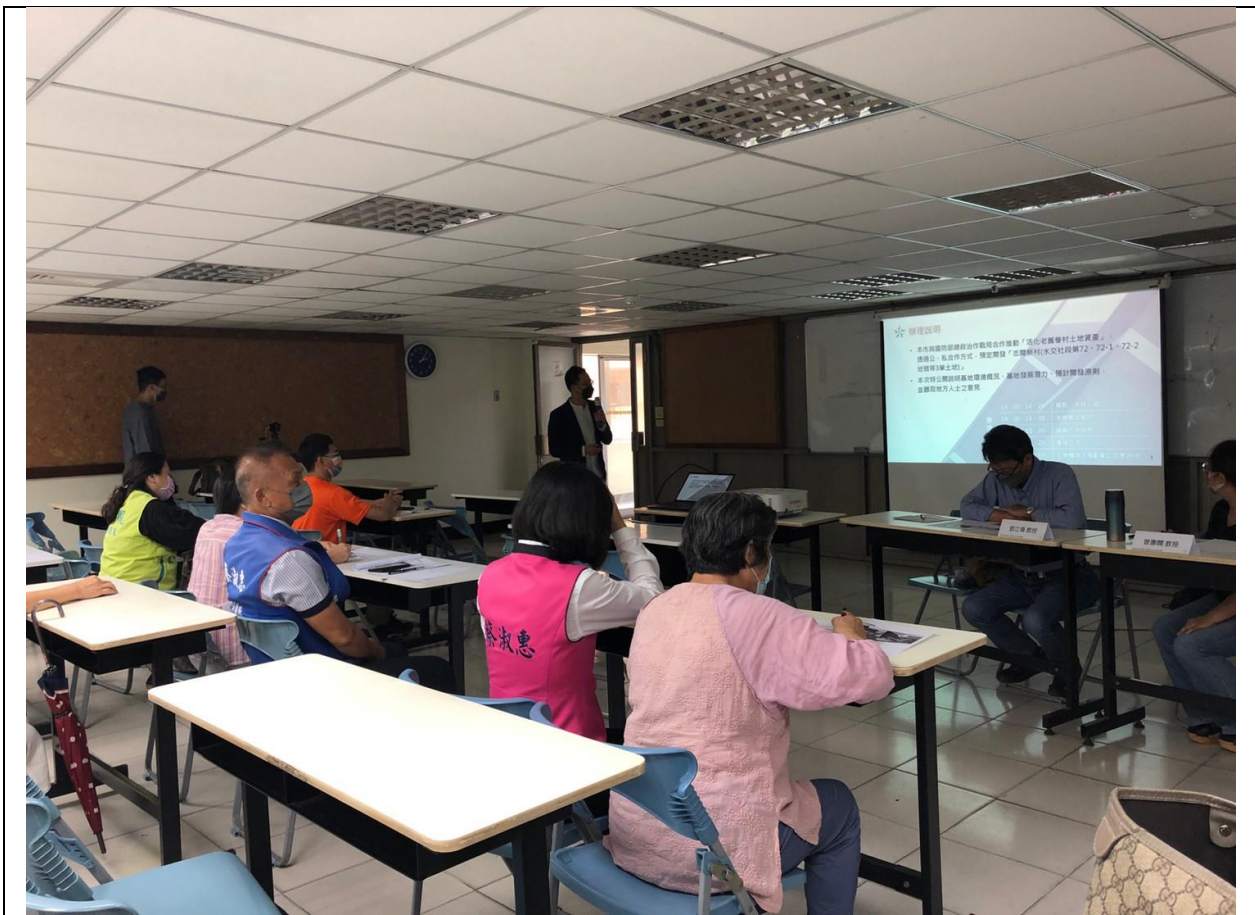
圖 4、說明會—案件內容說明