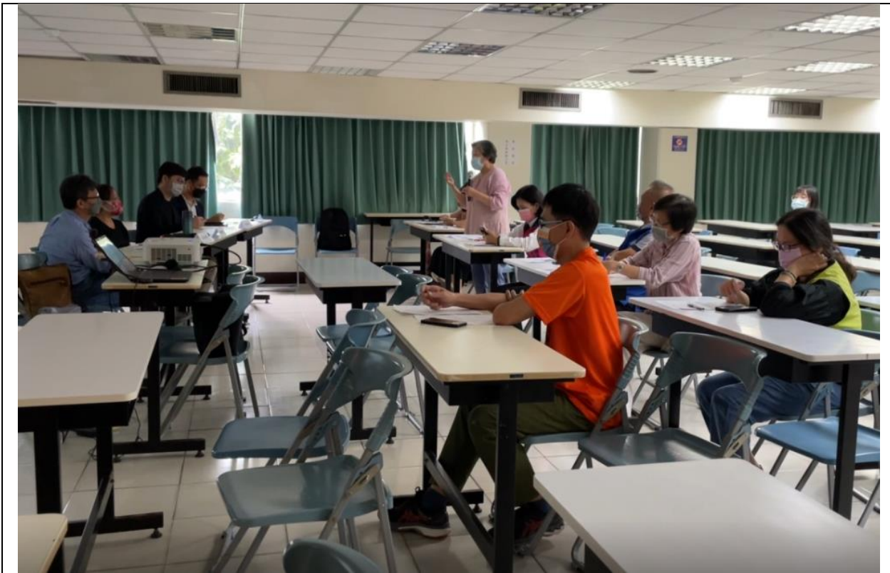
圖 10、說明會—相關意見交流(民眾發言)