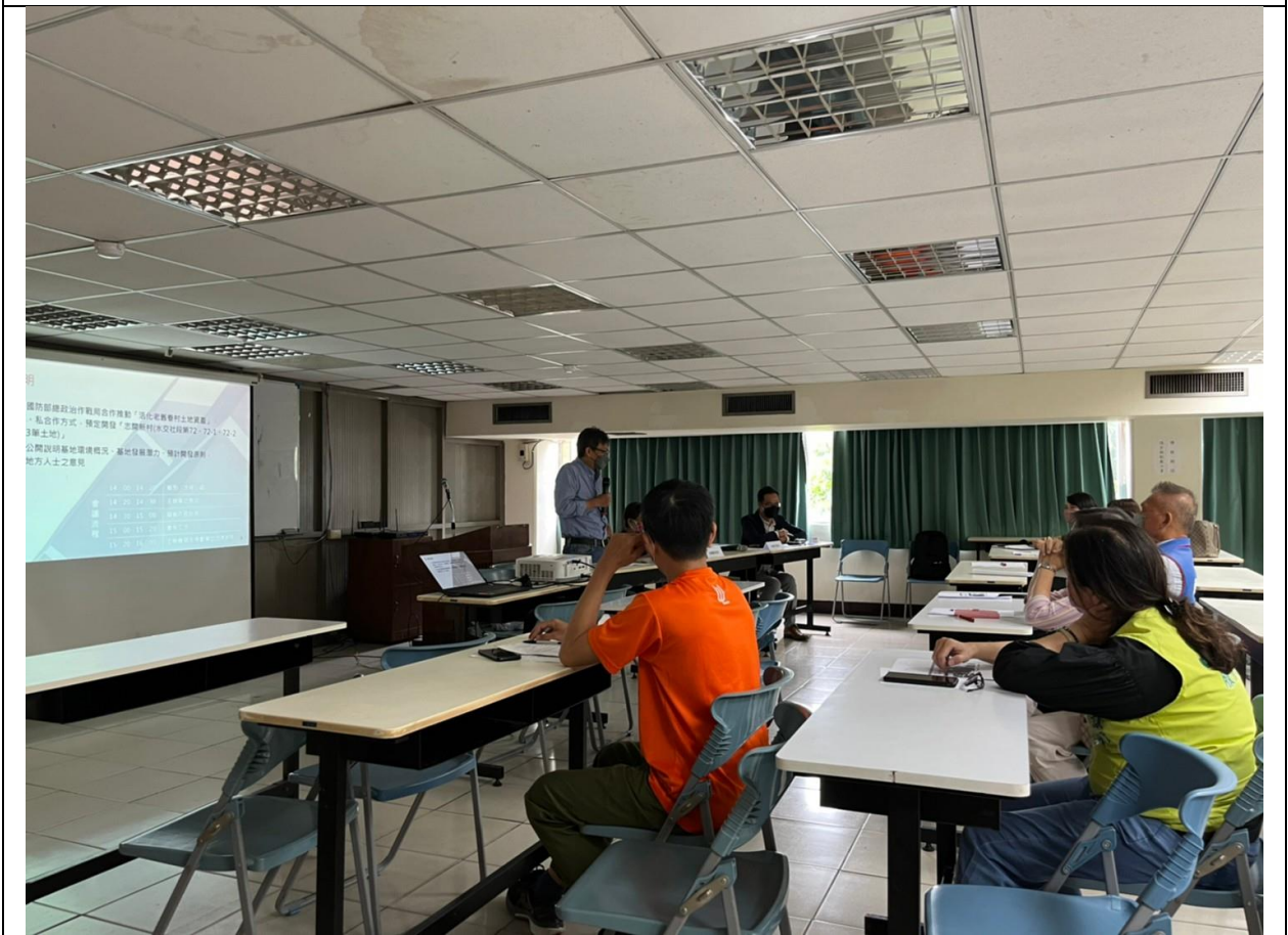
圖 7、說明會－專家學者意見與回應