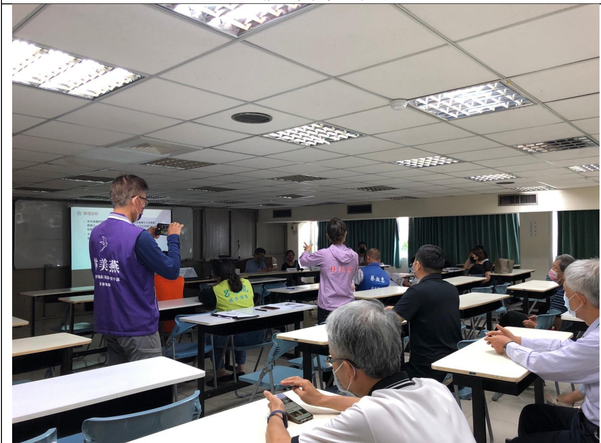
圖 9、說明會－相關意見交流(議員發言)