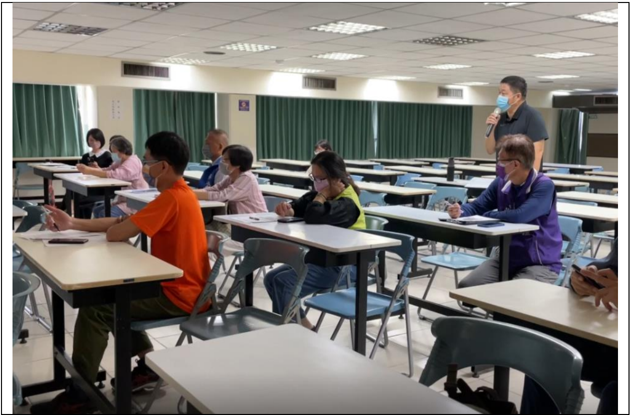
圖 12、說明會—相關意見交流(南瀛眷村文化館發言)