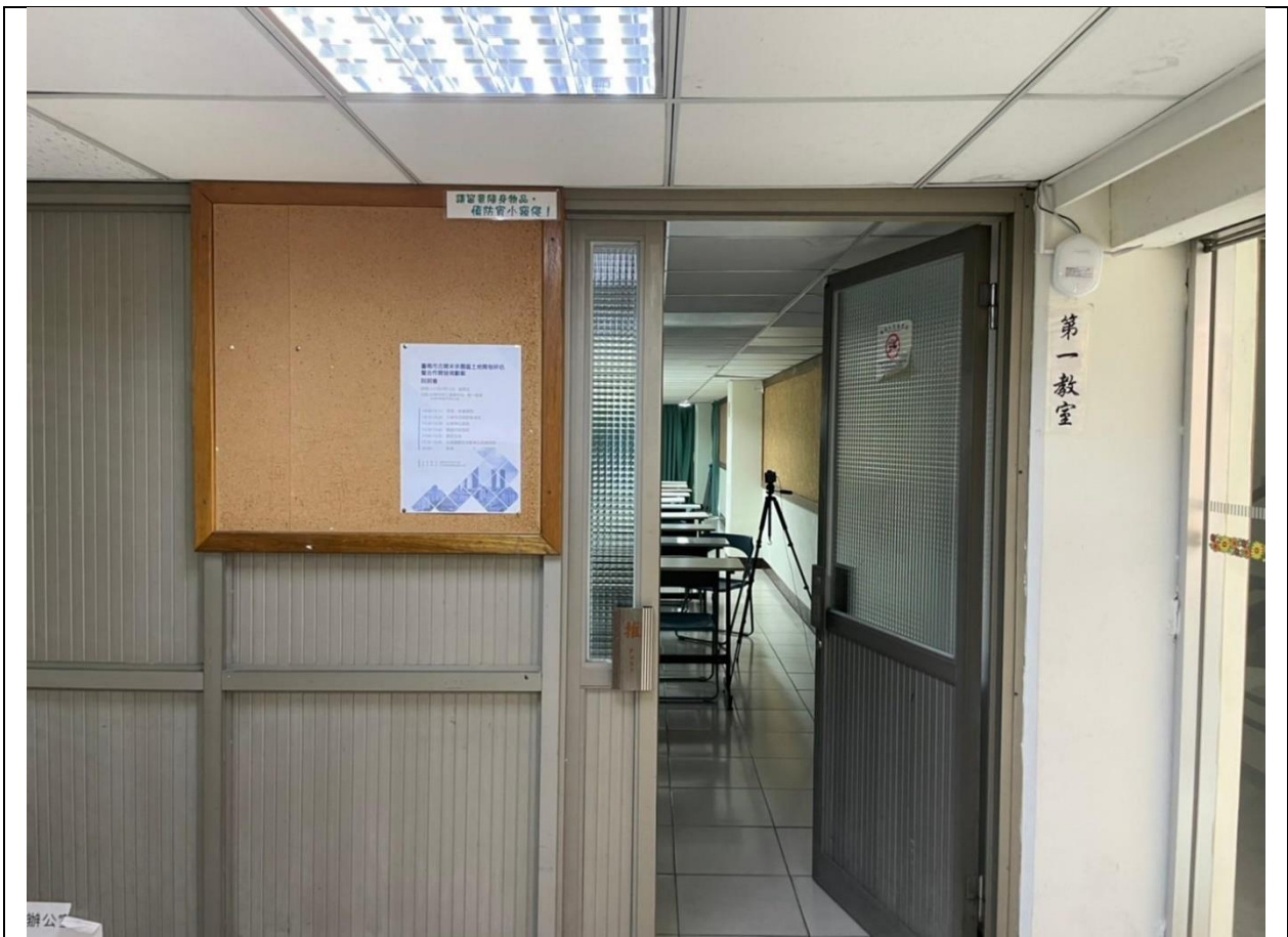
圖 2、說明會會場入口