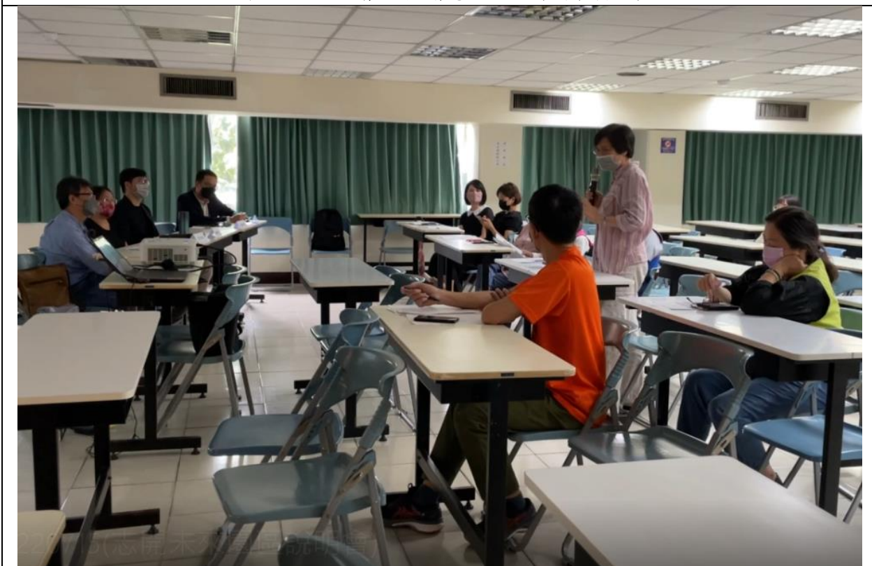
圖 11、說明會—相關意見交流(民眾發言)