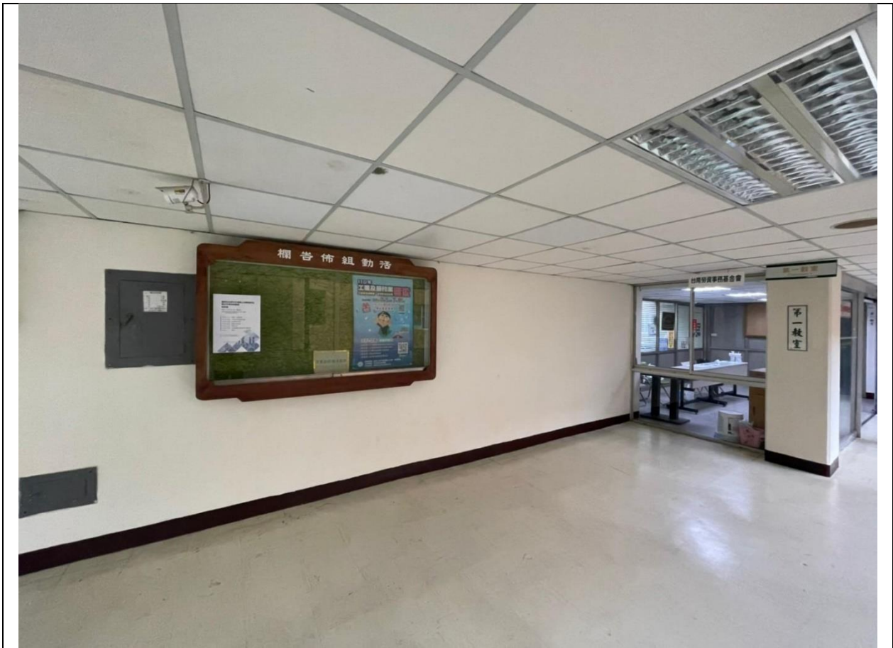
圖 1、111 年 7 月 15 日說明會地點（台南市勞工育樂中心第一教室）