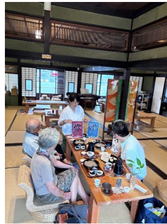
貳貳和茗園一本田三一宅藝文空間委外團隊向民眾說明性別友善重要性