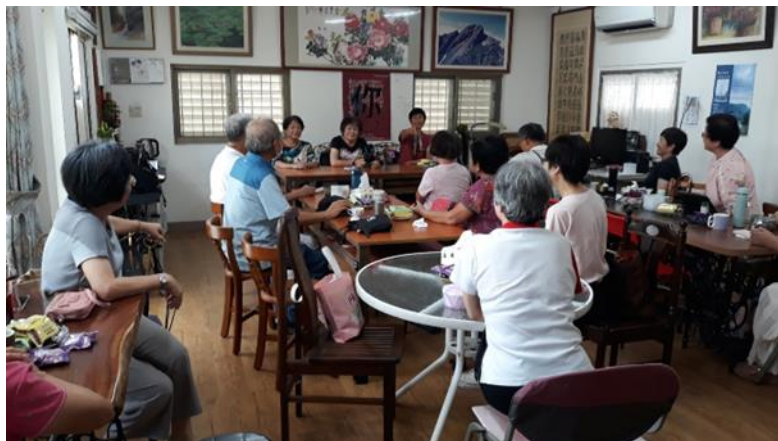
展覽解說組志工踴躍討論性別刻板印象議題