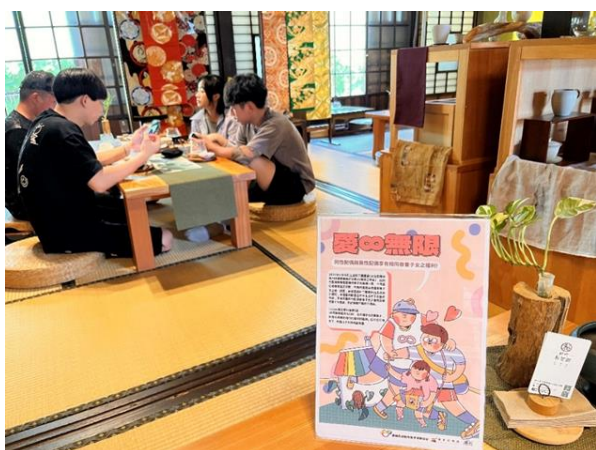
於貳貳和茗園—本田三一宅藝文空間擺放海報文宣，宣傳性別友善知識