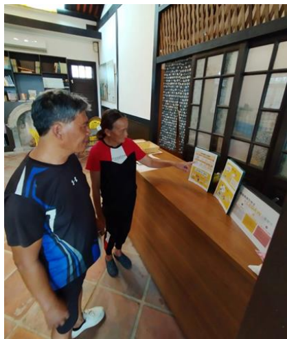
於劉啟祥美術紀念館擺放 CEDAW 海報宣導