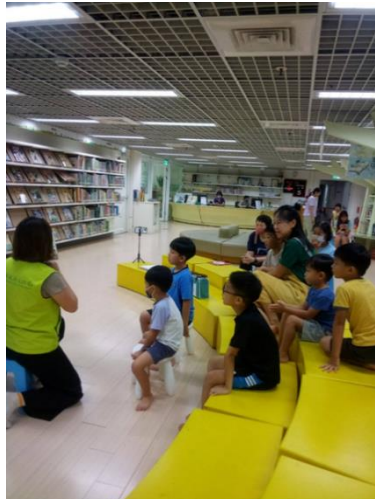
袋鼠媽媽說故事，帶領孩子從《Yes! No!》繪本瞭解尊重身體自主權，宣傳性別友善知識