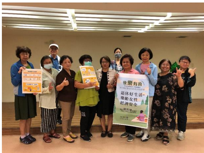
於快樂有約系列講座宣傳