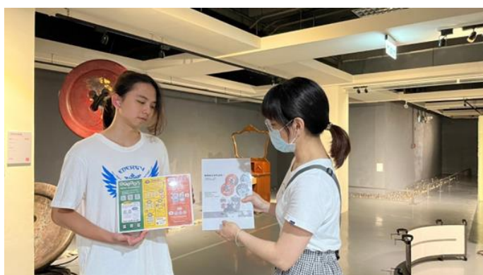
館員於新營文化中心第三畫廊向民眾宣導 CEDAW 觀念