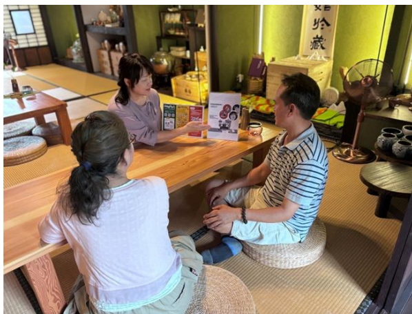
式式和茗園—本田三一宅藝文空間委外團隊向民眾說明性別友善重要性