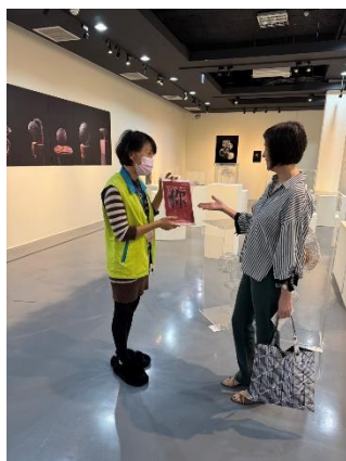
館員於新營文化中心文心第一畫廊向民眾宣導 CEDAW 觀念