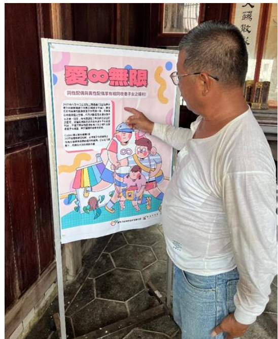
擺放海報文宣，運用本府 CEDAW 文宣宣導