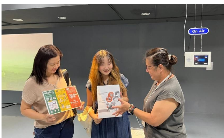
館員於新營文化中心第二畫廊向民眾宣導 CEDAW 觀念