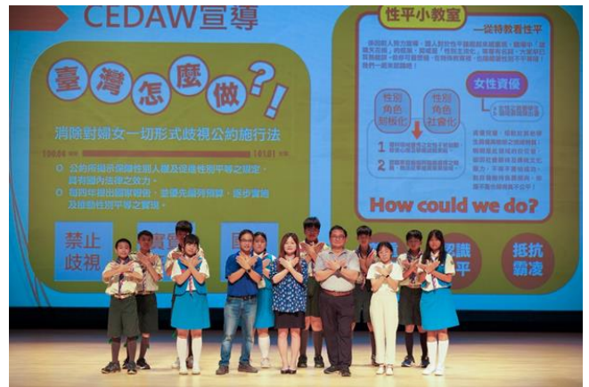
9/7 與衛生局合作辦理講座活動，向民眾說明臺灣 CEDAW 政策。9/7 名人講堂活動宣導 CEDAW 政策