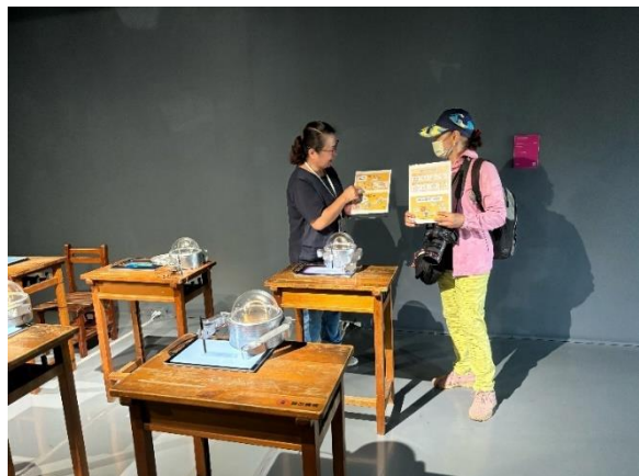
館員於新營文化中心第二畫廊向民眾宣導 CEDAW 觀念