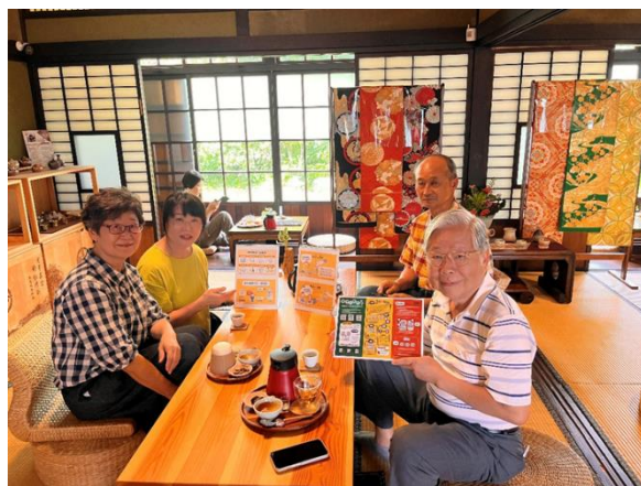
於貳貳和茗園—本田三一宅藝文空間擺放海報文宣，宣傳性別友善知識