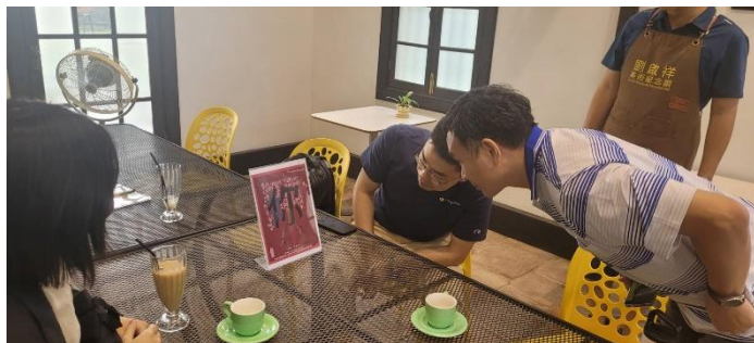
劉啟祥美術紀念館畫室咖啡委外團隊向民眾宣傳 CEDAW 知識