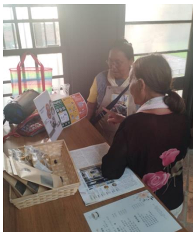
劉啟祥美術紀念館畫室咖啡委外團隊向民眾宣傳 CEDAW 知識