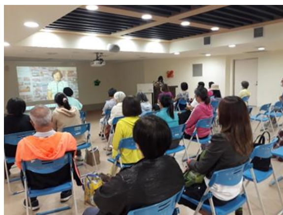
志工欣賞關心性別偏見及性別平權議題宣導短片