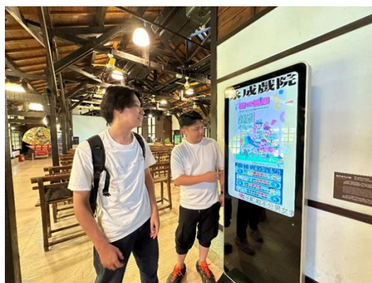
永成戲院透過電子看板，運用本府 CEDAW 文宣宣導