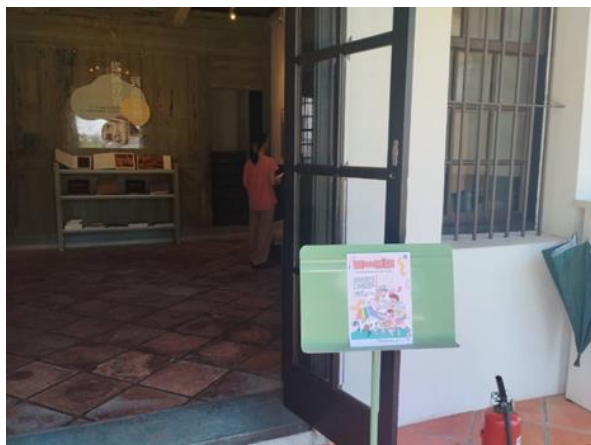
於劉啟祥美術紀念館擺放 CEDAW 海報宣導