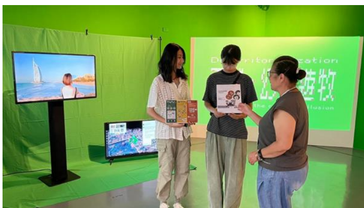
館員於新營文化中心文心第一畫廊向民眾宣導 CEDAW 觀念