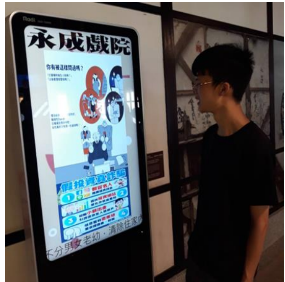
永成戲院以電子看板，運用本府 CEDAW 文宣宣導