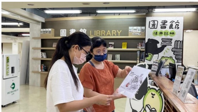
館員於新營文化中心圖書館向民眾宣導 CEDAW 觀念