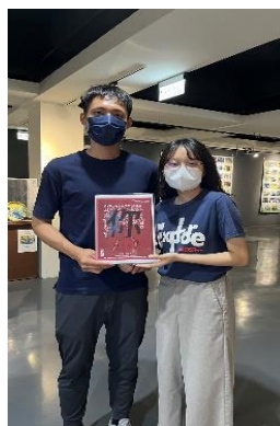
館員於新營文化中心第三畫廊向民眾宣導 CEDAW 觀念