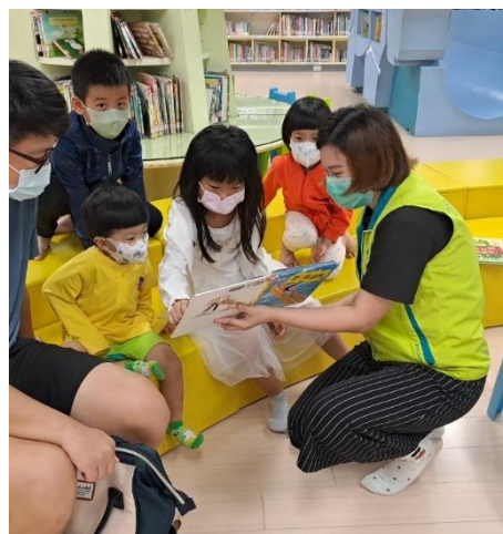
袋鼠媽媽說故事，以《 We' re All Wonders 》繪本，宣傳性別友善知識