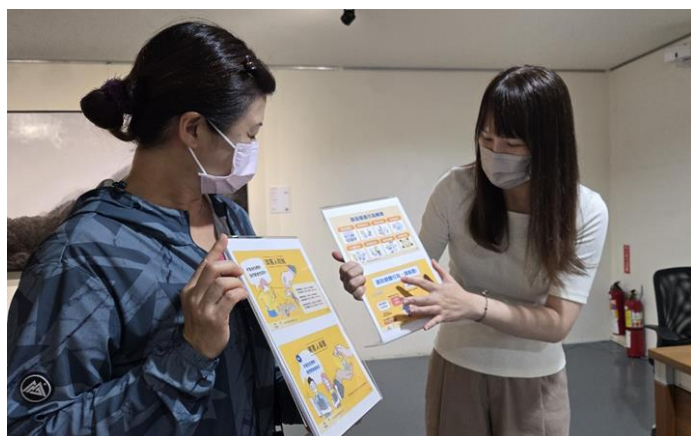
館員於新營文化中心文物陳列室向民眾宣導 CEDAW 觀念