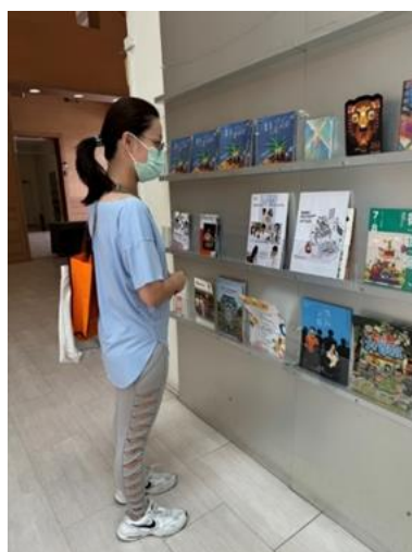
民眾於新營文化中心大廳閱讀 CEDAW 宣傳海報