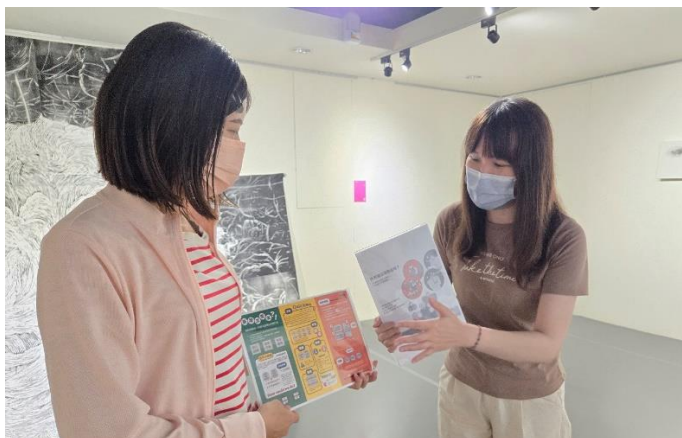
館員於新營文化中心雅藝館向民眾宣導 CEDAW 觀念