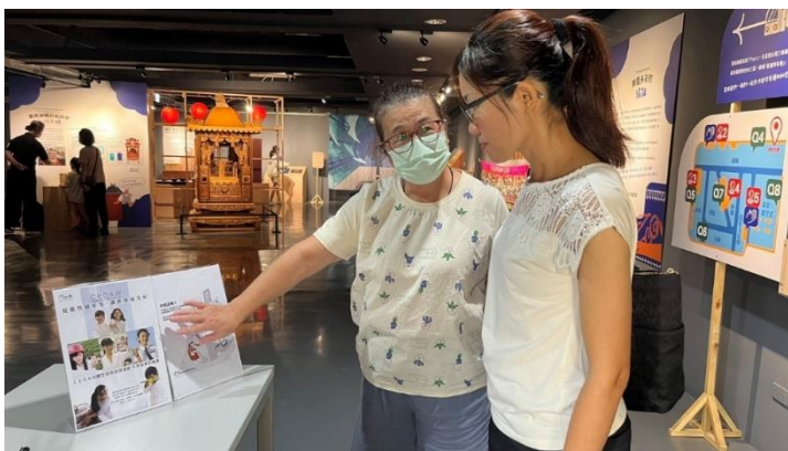
館員於新營文化中心第二畫廊向民眾宣導 CEDAW 觀念