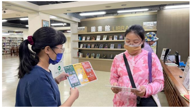
民眾於新營文化中心圖書館閱讀 CEDAW 主題書展書籍