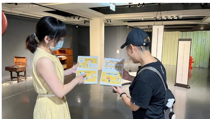
館員於新營文化中心第三畫廊向民眾宣導 CEDAW 觀念