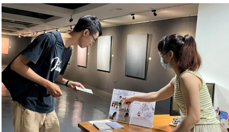
館員於新營文化中心第三畫廊向民眾宣導 CEDAW 觀念