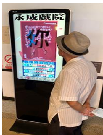
永成戲院透過電子看板，運用本府 CEDAW 文宣宣導