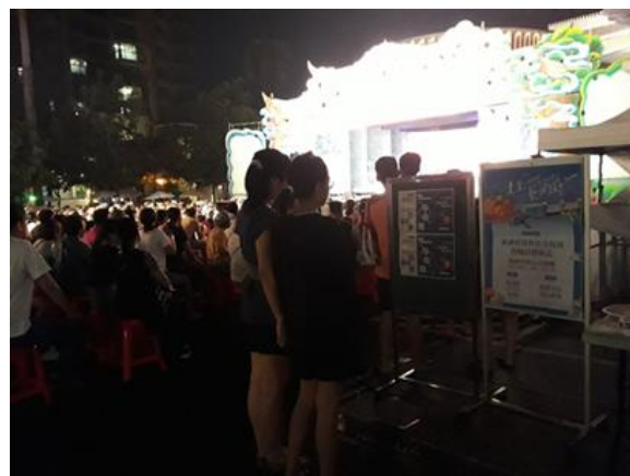
辦理大型戶外活動利用文宣推廣 CEDAW