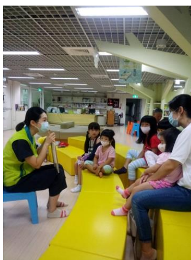
袋鼠媽媽志工於新營文化中心兒童閱覽室講述「國王的孩子們」繪本，傳遞多元可能性