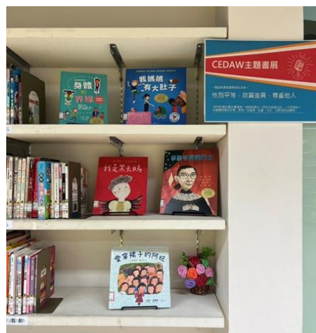
新營文化中心圖書館設置 CEDAW 主題書展，透過閱讀宣導性別平等議題