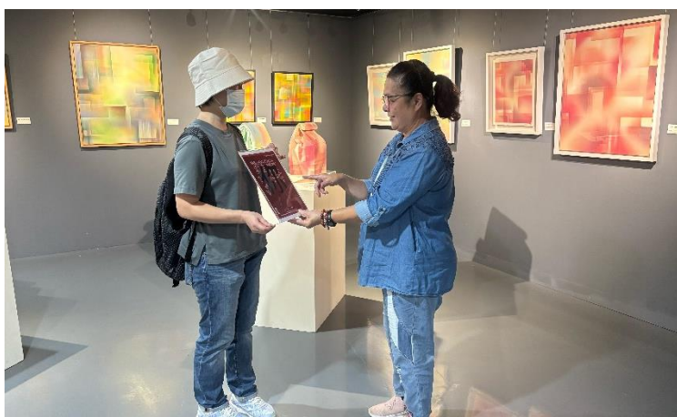
館員於新營文化中心第二畫廊向民眾宣導 CEDAW 觀念