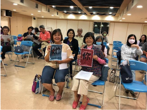
11/30 辦理講座活動，向民眾說明臺灣 CEDAW 政策