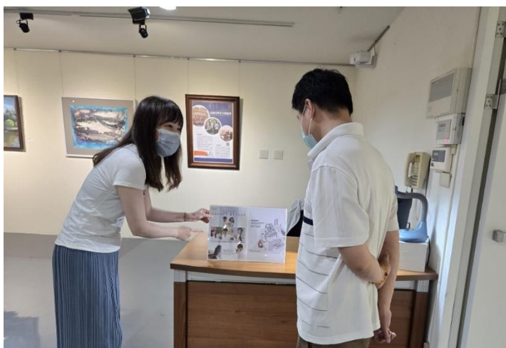
館員於新營文化中心文物陳列室向民眾宣導 CEDAW 觀念