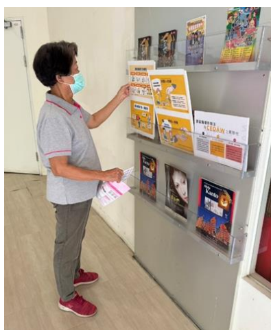
民眾於新營文化中心大廳閱讀 CEDAW 宣傳海報