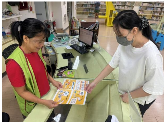
館員於新營文化中心圖書館向民眾宣導 CEDAW 觀念