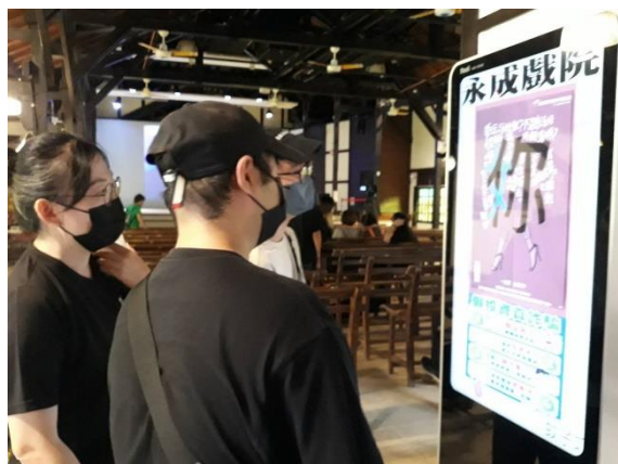
永成戲院透過電子看板，運用本府 CEDAW 文宣宣導