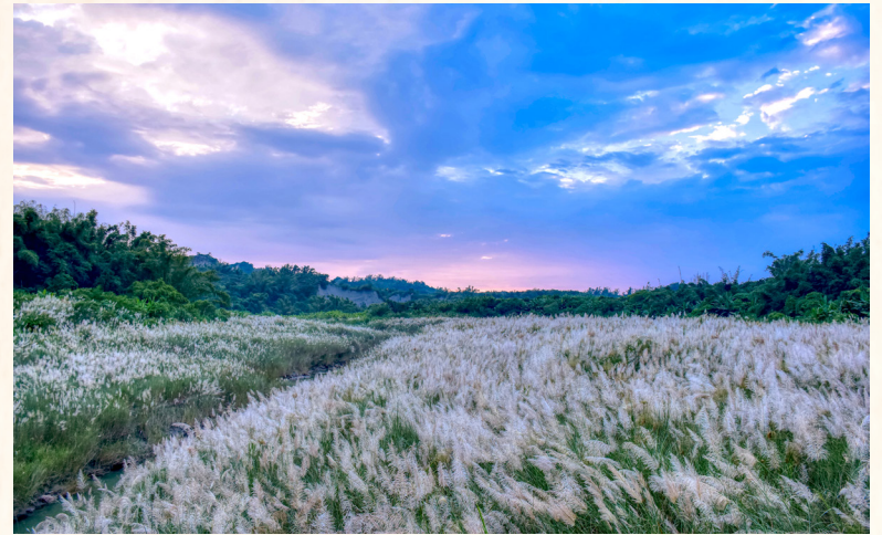
左鎮外岡林，建議傍晚前前往，可看見天空多種雲彩變化；入秋，有管芒花景似雪。

沿著光山道路前往澄山社區，每前進一哩，就被更翠綠的山景與更響亮的鳥叫蟲鳴環抱。社區涵蓋4個聚落，原名「山豹」，二戰後因名稱感覺過於兇惡，改以當地山深多麗、水澄山清特色，命名「澄山」。居民多屬西拉雅族大目降社，和公館社區一樣面對人口外移考驗，500多人口以中高齡佔多數。社區除為耆老進行口述歷史與文化紀錄，也盼打造無汙染且物產豐饒的平埔族旅遊景點，留住年輕人、帶入活力。