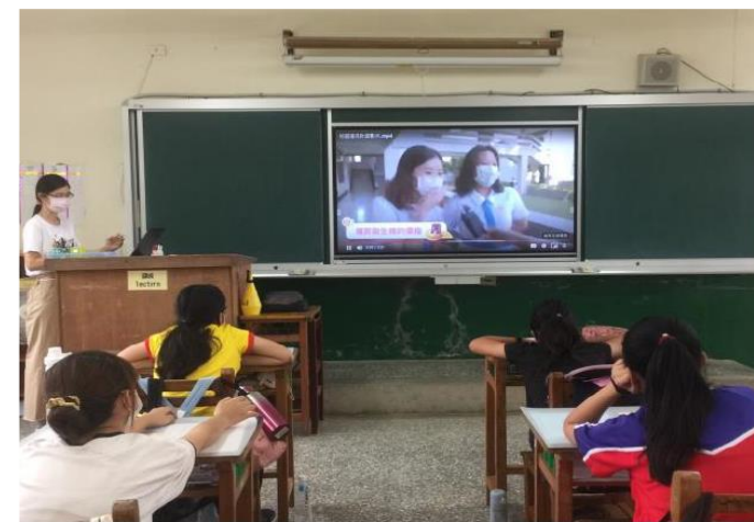
教師宣講月經教育課程