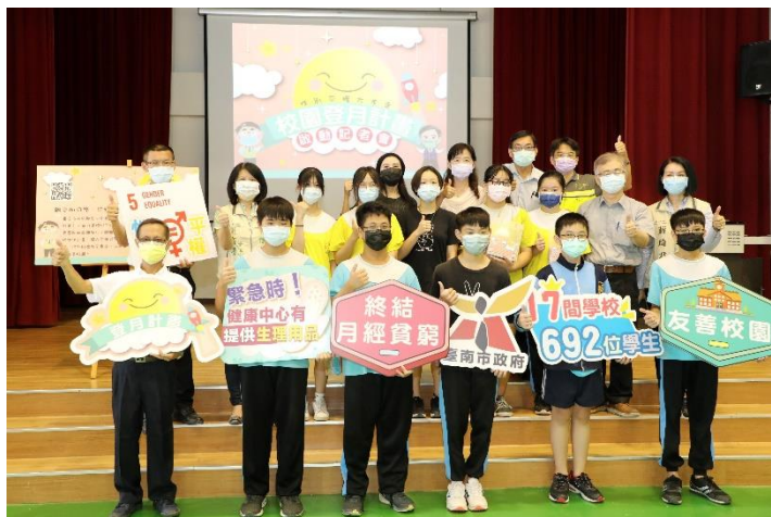
於學校辦理校園 登月計畫記者會