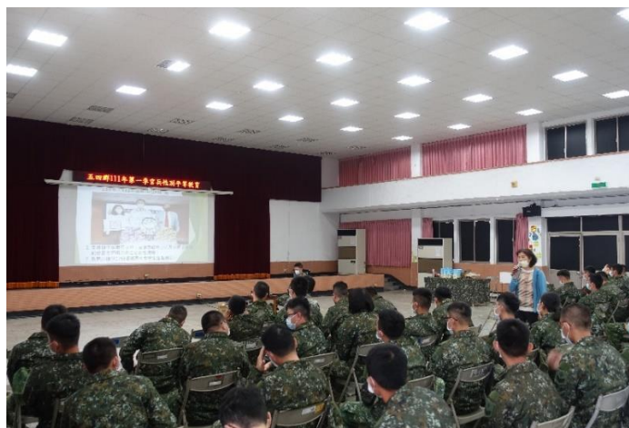
於軍方辦理性平講座宣導