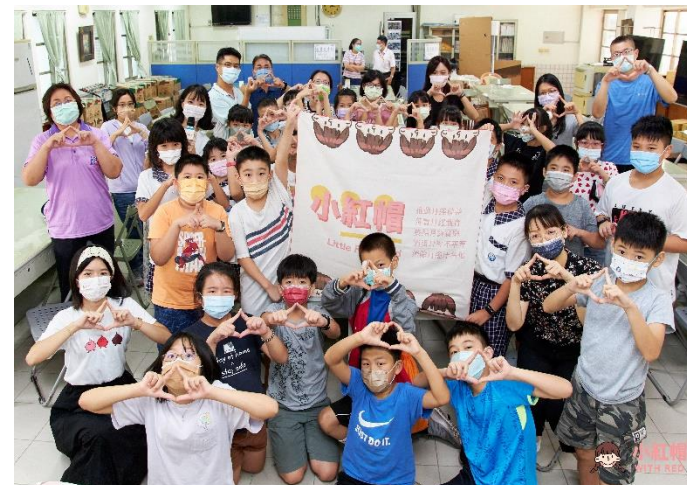
全球小紅帽協會到校宣導