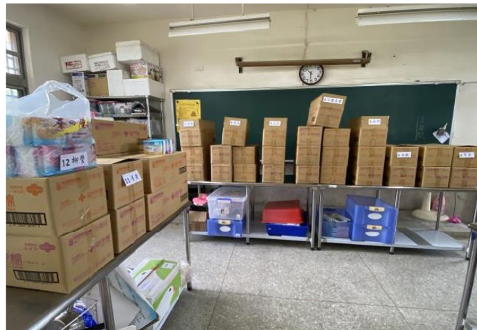
愛心企業捐贈每生 每月2份生理用品