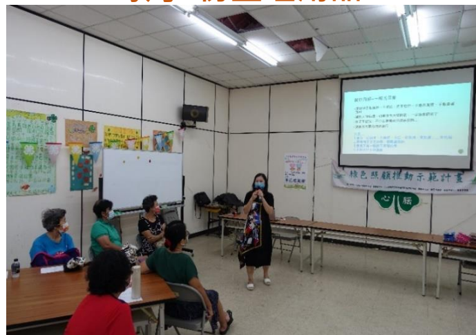
於農會辦理性平講座宣導